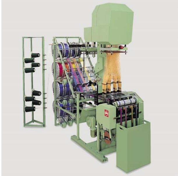
Jakar makineli NFJM2 dokuma tezgahımız