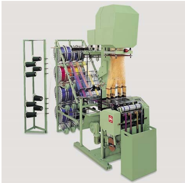
Webmaschine NFJM2 mit Jacquardmaschine