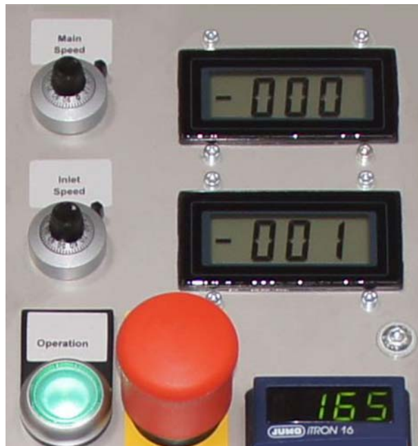
Panel de mando (también disponible con encoder)