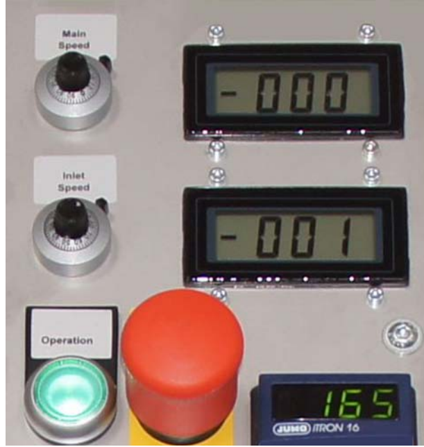
İş paneli (ayrıca kodlayıcı ile de mevcuttur)